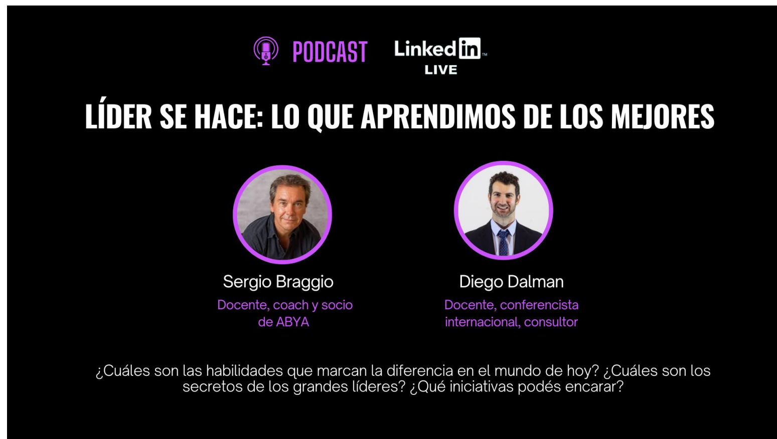
Live podcast sobre Liderazgo