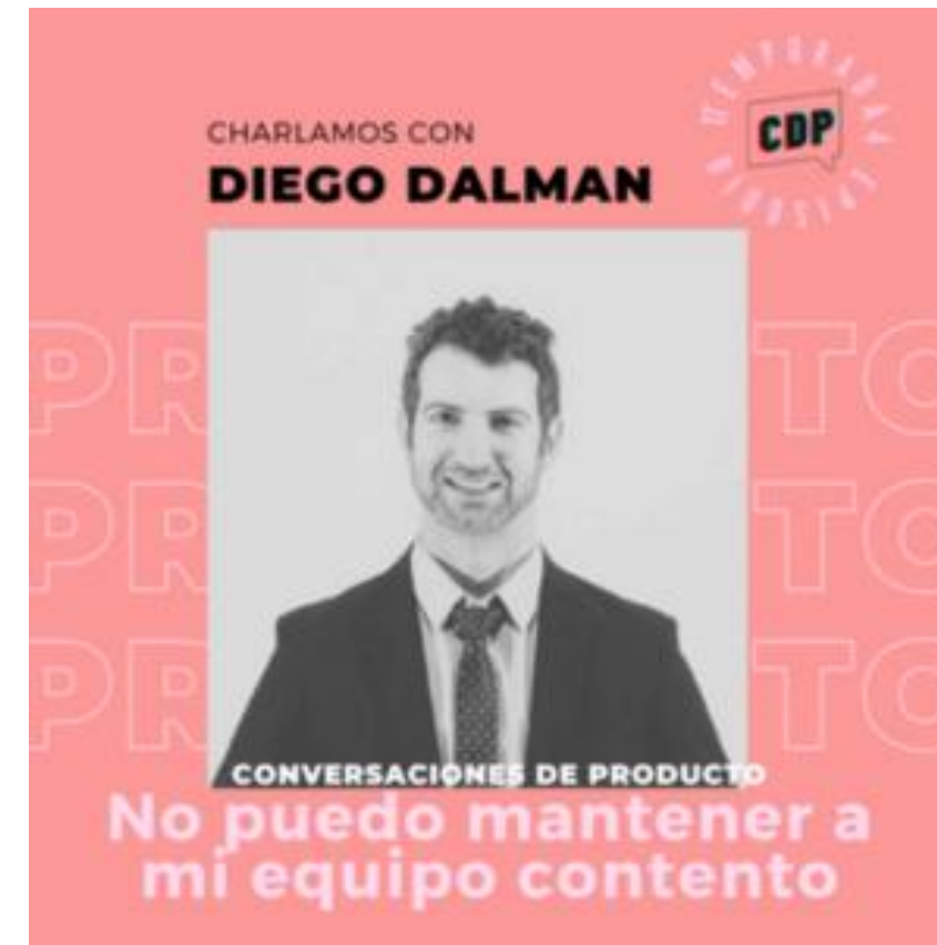
Entrevista en CDP: liderazgo en tecnología