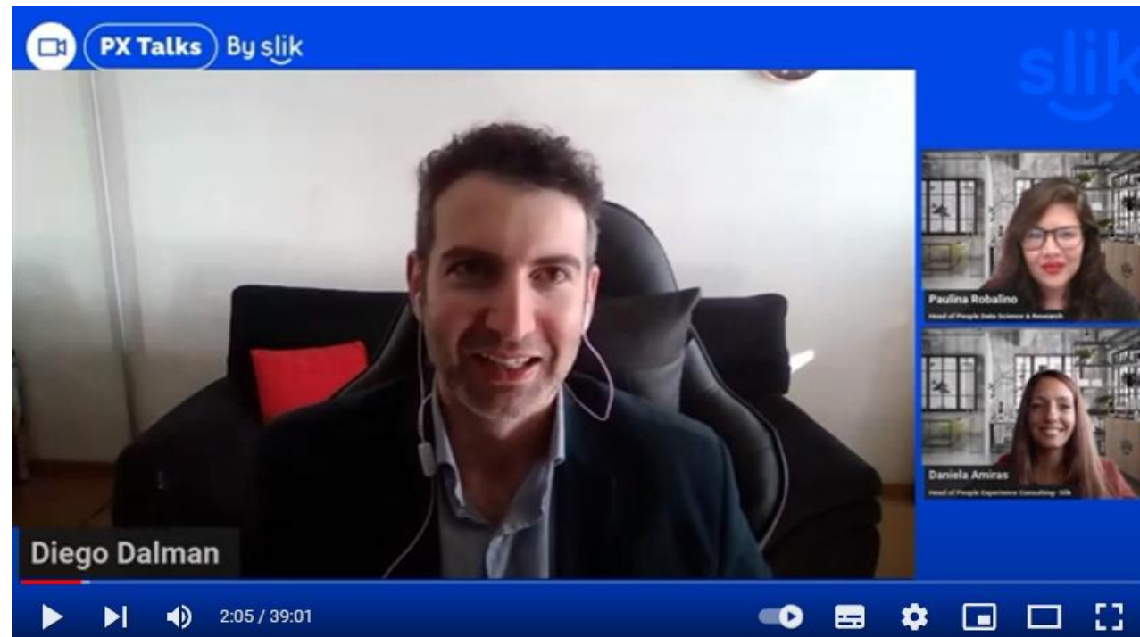
Entrevista PX Talks