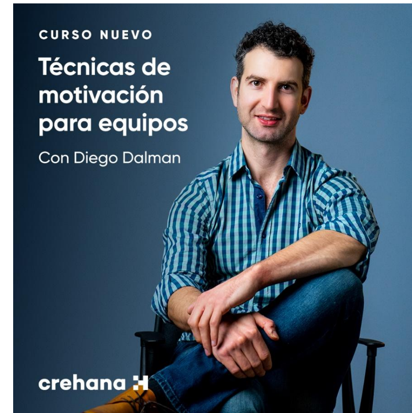
Una clase de su curso